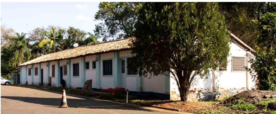
Figura 9 - Antigas casas de colono, preservadas e reutilizadas para outras finalidades. Data: ago. 2023.