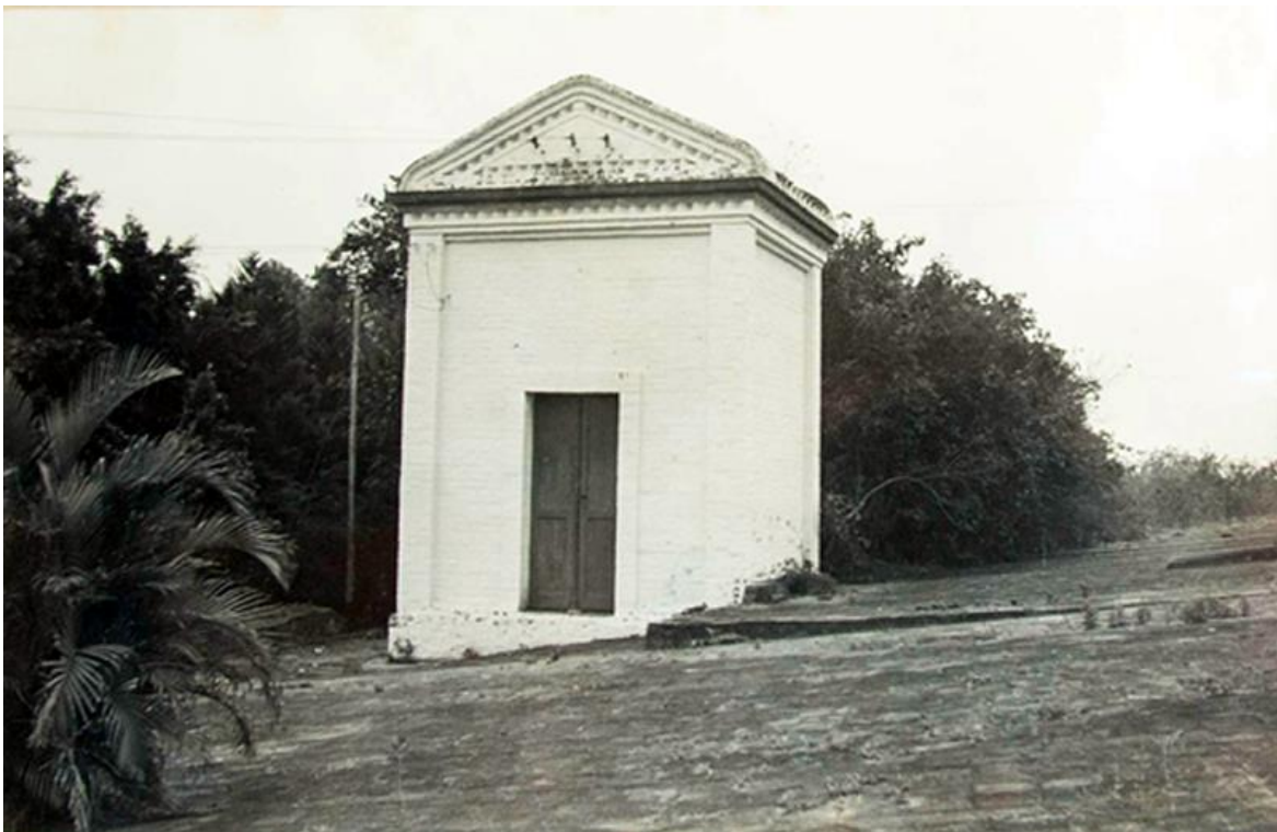
Figura 11 - Casa de Força e terreiro de café pavimentado com lajotas e tijolos, incorporados à área institucional do Instituto Biológico em Campinas/SP.