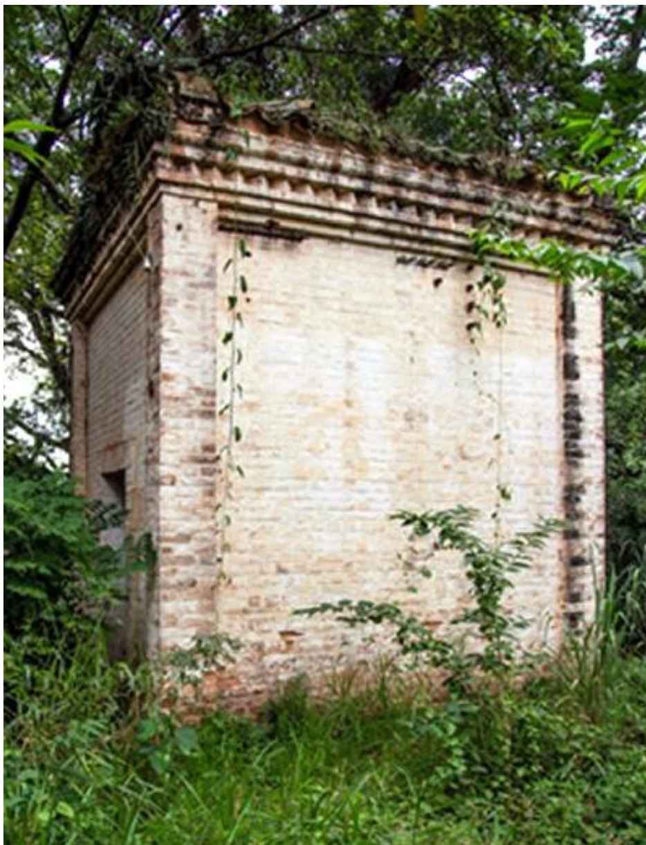
Figura 12 – Fachada frontal e lateral da Casa de Força. Data: abr. 2024.

Observa-se que a transformação em estação experimental, que ocorreu em 1937, foi um momento muito significativo na trajetória de inovação da Fazenda Mata Dentro, quando, sob a direção de Henrique da Rocha Lima, o Instituto Biológico incorporou a propriedade ao seu campo experimental (BATISTA FILHO et al., 2017). A partir desse momento, a fazenda foi transformada em uma estação de pesquisa científica, ampliando a atuação institucional do Instituto Biológico para além do ambiente estritamente laboratorial e estabelecendo a área como um espaço dedicado a estudos aplicados à agropecuária e à sanidade vegetal.