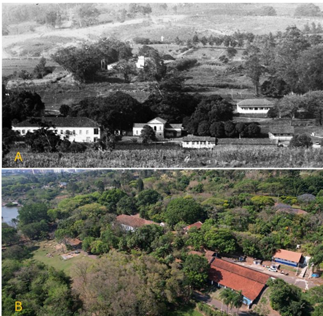
Figura 4 - A) Vista panorâmica da antiga Fazenda Mato Dentro. A esquerda da imagem, na parte inferior, fachada lateral da casa sede. Ao lado da casa sede, mais ao meio da imagem, a tulha e a direita da imagem, na parte inferior, garagem e cocheira. Fonte: Acervo do Instituto Biológico – SP, s/d, B) Imagem, em 2024. Fonte: Daniel Bertinato Perez. Data: out. 2024.

região de Campinas se consolidar como centro agrícola da província e porta de entrada da rubiácea no então denominado Oeste Paulista 24 . Ao longo do século XIX e até as primeiras décadas do século XX, período em que o desenvolvimento do complexo cafeeiro do Oeste Paulista tornou o café competitivo no mercado internacional e o principal produto de exportação brasileiro, a Fazenda Mato Dentro manteve-se ativa na produção e exportação.