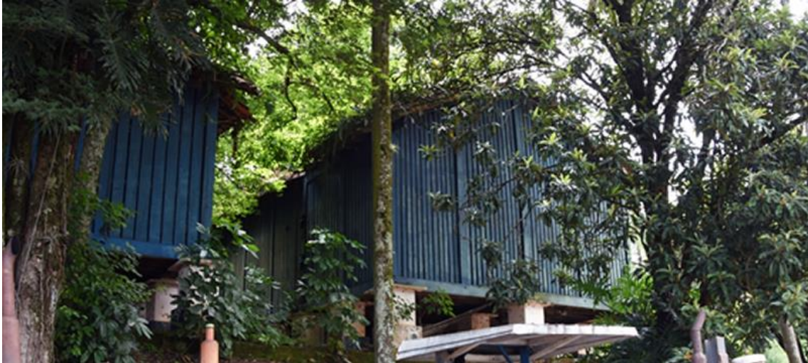
Figura 7 – Paiol. Data: ago. 2023