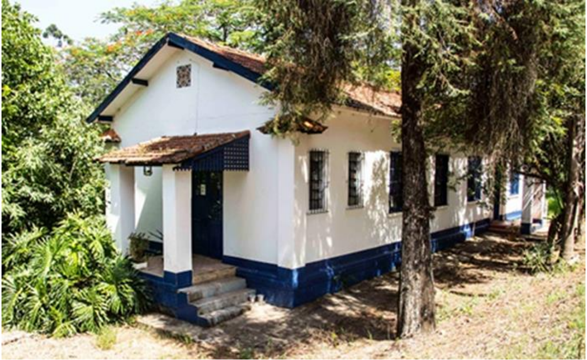
Figura 10 - Edifício da Administração II do Instituto Biológico em Campinas/SP Data: dez. 2023.