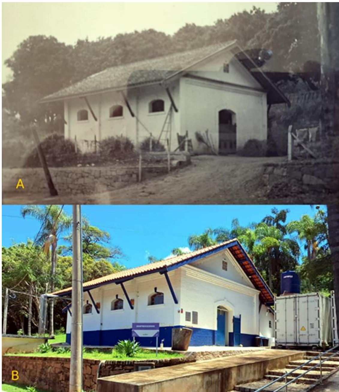
Figura 14 – A) Antiga cocheira (ou selaria); B) Edifício adaptado para abrigar o Laboratório de Bioprocessos da Unidade Laboratorial de Referência em Controle Biológico do Instituto Biológico, em Campinas/SP.