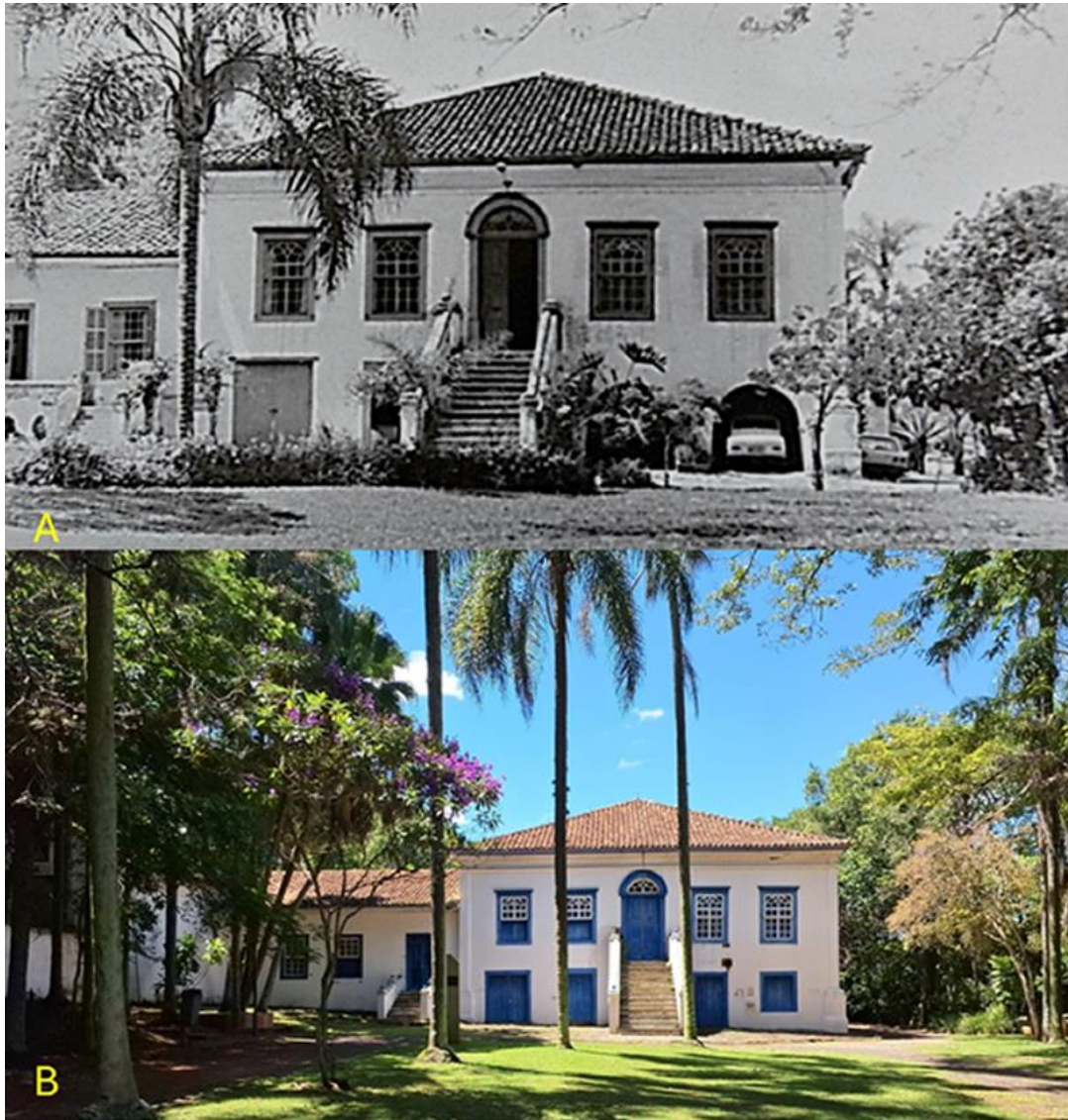
Figura 1 - Casa sede da antiga Fazenda Mato Dentro. A) Acervo do Centro de Memória do Instituto Biológico - SP, s/d, B) imagem, em 2026.