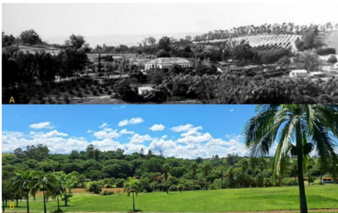
Figura 2 - A) vista panorâmica da fazenda mato dentro onde observamos ao centro a casa sede, à direita da casa sede, tulha e casas de colonos e a esquerda da imagem, acima da casa sede, antigo terreiro de café. (a imagem em tela é um recorte na imagem original).

a legislação fundiária desse período se caracterizasse pela fragmentação e pela ausência de um corpo normativo sistematizado, as sesmarias consolidaram-se como o principal instrumento de ordenamento territorial, sendo responsáveis pela ocupação e pelo cultivo das terras no interior do Brasil.