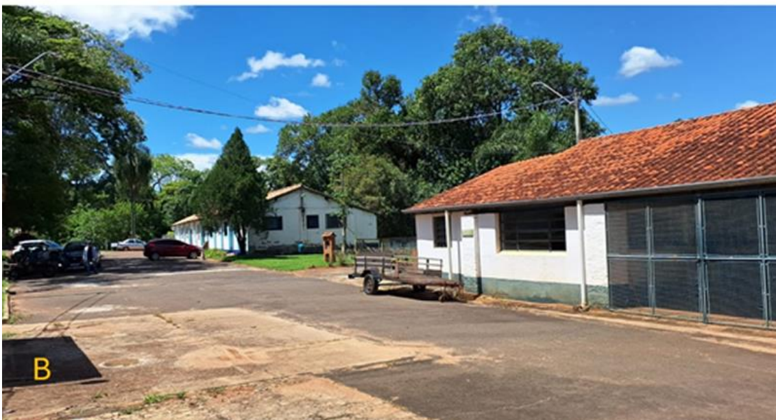
Figura 5 – A) A imagem registra a construção das muretas de pedra ao lado da antiga cocheira. À direita da imagem, no primeiro plano, podemos observar a garagem, ao fundo deste mesmo lado, casas de colonos e a edificação entre as duas não existe mais atualmente. Data: out. 1939., B) Imagem, em 2026.

Anos mais tarde, em 1937, a Fazenda Mato Dentro foi adquirida pelo Governo do Estado de São Paulo, que nela instalou a Fazenda Experimental do Instituto Biológico, em atendimento às demandas da agricultura paulista relacionadas à defesa