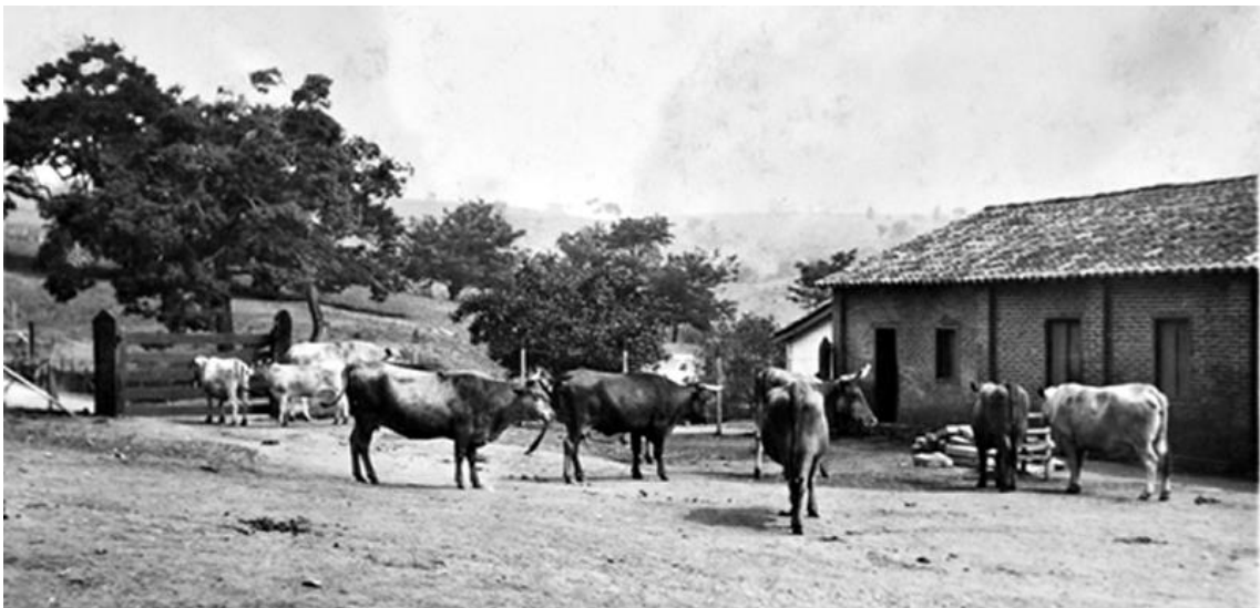
Figura 8 – A direita da imagem, casas de colonos. Data: out. 1939.