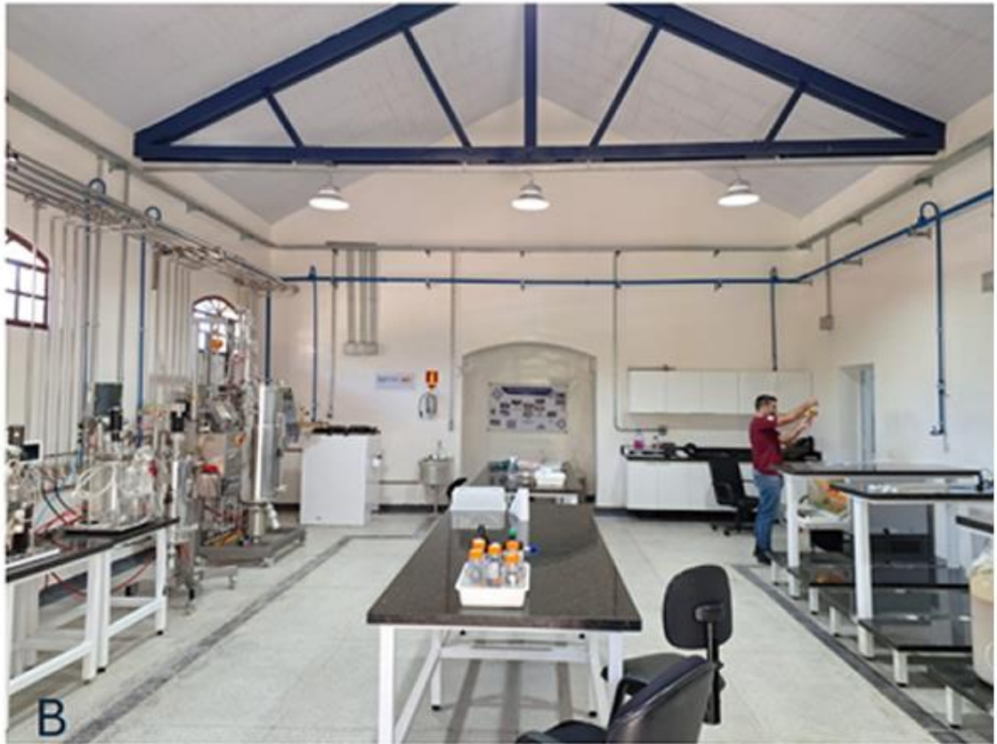
Figura 15 – A) antiga cocheira (ou selaria), B) Laboratório de Bioprocessos.