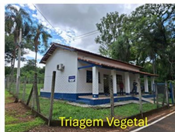
Figura 13 - Conjunto de laboratórios do DAPSA/IB dedicados à pesquisa em sanidade vegetal Data: fev. 2026.