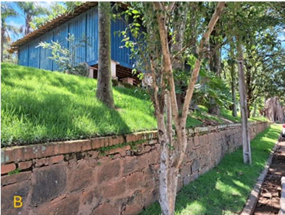
Figura 6 – A) Construção das muretas de pedra. Ao fundo da imagem, paiol. Fonte: Acervo do Instituto Biológico – SP. Crédito da Imagem: B. U. Mazza. Data: out. 1939., B) Imagem, em 2026.